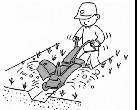
3月上旬までに行い、暖冬の年ほど徹底する。